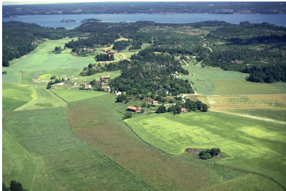
Figur 1. Det storskaliga slättlandskapet på nordöstra Mörkö i förgrunden med de tydligt utbildade sprickdalarna mot Himmerfjärden i väster. Jan Norrman, Riksantikvarieämbetet, 1991.

Socknen karaktäriseras naturegeografiskt av ett utpräglat sprickdalslandskap med smala långsträckta dalgångar i SSV-ONO, N-S och VNV-OSO sträckning omgivna av höjdparter med morän och berg i dagen. Berggrunden består företrädesvis av granit och gnejs med på vissa platser stort inslag av urkalksten, som vid Egelsvik och ön Oaxen. I dalgångarna återfinns både glacial och postglacial lera. I de lägsta delarna förekommer gyttejlera. Strandförskjutningen har i de låglänta partierna av socknen, vilka bitvis är mycket omfattande framförallt utmed de västra stränderna och i nordöstra delen, inneburit avsevärd landvinning på relativt kort tid. I de vanligt förekommande tydligt rundade bergsformationerna är isens slipverkan tydlig. Isälvsavlagringar förekommer på ett fåtal platser på norra delen av ön, t ex vid Näsbacken och Skansholmen. Mörkö's högsta punkt återfinns på Fruberget, på 61,3 meters höjd. Väster om Söräng finns mossmark, i övrigt finns nästan inga vattendrag, våtmarker eller insjöar på Mörkö.