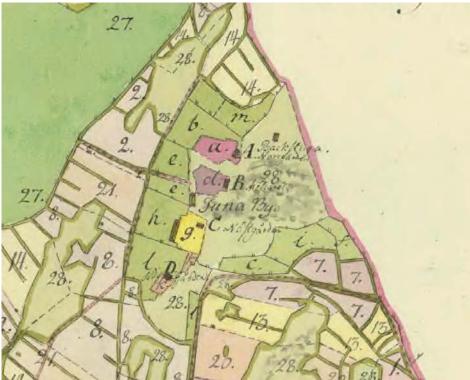
Figur 3. De reglerade gårdstomterna utmed byvägen i Tuna by år 1789.

På 1940-talet bestod Tuna av 94 ½ hektar mark, varav 80 hektar åker. Det fanns även 12 ½ hektar kultiverad betesmark och två hektar övrig mark. Åkern brukades i 6-årig växtföljd. Djurbesättningen bestod av 5 ardennerhästar, 30 kor, svin till husbehov samt ett trettiotal höns.